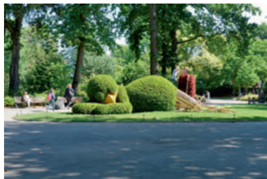
Nantes, le jardin des plantes

Experts-comptables de justice Commissaires généraux du 55 e congrès