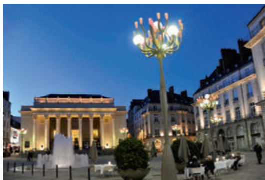
Nantes, place Graslin

Le 55 e congrès national aura lieu à Nantes les 6, 7 et 8 octobre 2016.