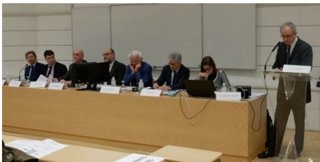
Les intervenants dans l'amphi Duguit - Pey Berland Bordeaux

I. - Dans les cas où la loi renvoie au présent article pour fixer les conditions de prix d'une cession des droits sociaux d'un associé, ou le rachat de ceux-ci par la société, la valeur de