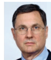
Gilles de COURCEL